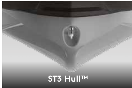
ST3 Hull ™

Vattentätt och stöttåligt fack särskilt avsett för att skydda telefoner. 2