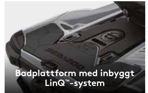
Badplattform med inbyggt LinQ ™ -system

Med branschens första tillverkarinstallerade och helt vattentäta Bluetooth † -ljudsystem.