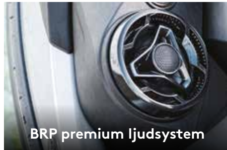
BRP premium ljudsystem

Stort främre förvaringsutrymme smidigt åtkomligt från sittande position. 1