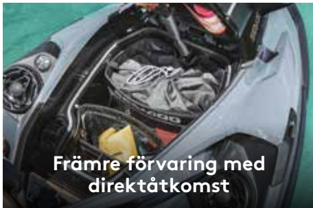
Främre förvaring med direktåtkomst

Stort främre förvaringsutrymme smidigt åtkomligt från sittande position. 1