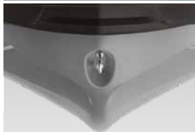
ST 3 HULL ™