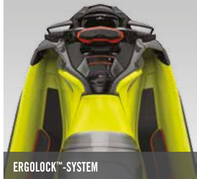
ERGOLOCK ™ -SYSTEM