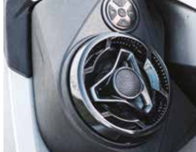
BRP AUDIO PREMIUM (TILLVAL) 2

Typ Rotax ® 1630 ACE ™ Insugssystem Kompressormatad med intercooler Cylindervolym 1 630 cc Kylning Slutet kylsystem (CLCS) Backsystem Elektroniskt iBR ® Startsystem Elstart Bränsletyp 95 oktan (minimum) 91 oktan (rekommenderas)