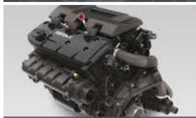
ROTAX ® 1630 ACE ™ -MOTOR