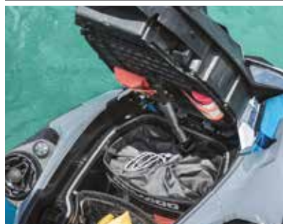
FRÄMRE FÖRVARING MED DIREKTÅTKOMST 3