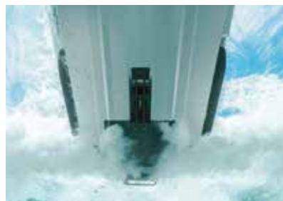
IBR ® GEN 3 (INTELIGENTE BRAKE & REVERSE)