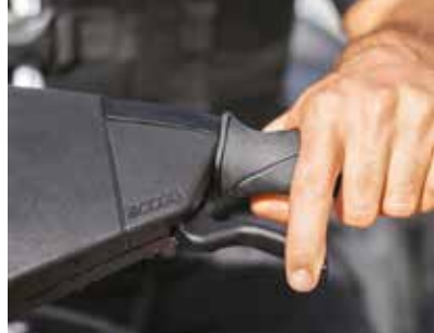
iBR® (INTELLIGENT BRAKE & REVERSE)