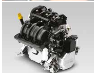
ROTAX® 900 HO ACE™-MOTOR