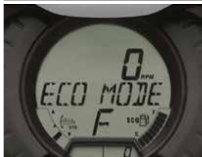
MANÖVERCENTRAL MED ECO®-LÄGE